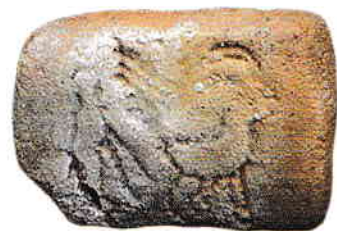
Tăblițele de lut ars de la Tărtăria

șiruri de împunsături fine ce desenează motive unghiulare și meandrice. Plastica antropomorfă a acestei culturi este cu adevărat excepțională. Formele sunt modelate realist, cu totul excepționale fiind cunoscutul Gânditor (autorul descoperirii s-a gândit la lucrarea lui Rodin) și replica lui feminină, ambele descoperite în așezarea de la Cernavodă. Aceste statuete au fost puse, pe bună dreptate, în legătură cu plastica de la Hacilar, din Anatolia.