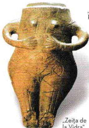
„Zeița de la Vidra”

a fost o născocire a populației locale, nefiind exclus ca ea să fi fost introdusă în urma legăturilor cu regiuni în care prelucrarea metalelor începuse mai devreme (Orient Apropiat ori Caucaz). Eneoliticul constituie un notabil salt calitativ în