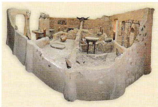
Vedere panoramică a sanctuarului neolitic de la Parța reconstruit în Muzeul Național al Banatului

La sfârșitul etapei Vinča A2 a luat naștere cultura Banat, în cadrul căreia au fost sesizate anumite particularități zonale (grupele Bucovăț și Parța). Așezarea de la Parța (jud. Timiș), intens cercetată, demonstrează că această cultură a atins un grad de civilizație marcat de existența construcțiilor cu etaj și de o viață spirituală complexă, descifrabilă în parte prin componentele marelui sanctuar cercetat aici. Edificiul de cult (cu dimensiunile maxime de 12,6 × 7 m), prezen-