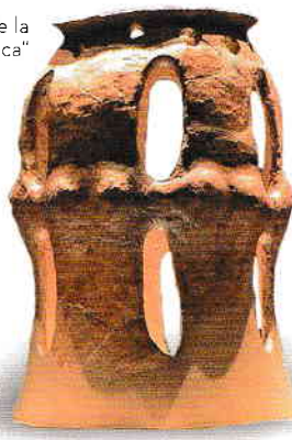
„Hora de la Frumușica”