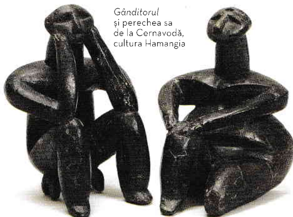
Gânditorul și perechea sa de la Cernavodă, cultura Hamangia

șiruri de împunsături fine ce desenează motive unghiulare și meandrice. Plastica antropomorfă a acestei culturi este cu adevărat excepțională. Formele sunt modelate realist, cu totul excepționale fiind cunoscutul Gânditor (autorul descoperirii s-a gândit la lucrarea lui Rodin) și replica lui feminină, ambele descoperite în așezarea de la Cernavodă. Aceste statuete au fost puse, pe bună dreptate, în legătură cu plastica de la Hacilar, din Anatolia.