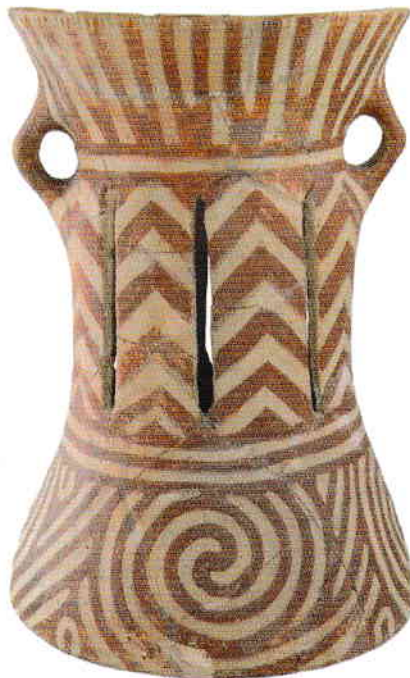
Suport de tip „horă”, pictură albă și roșie, Drăgușeni (jud. Botoșani), cultura Cucuteni A

ce alții o privesc ca rezultat al unei migrații din zonele sudice ale Balcanilor. Este cunoscută în primul rând prin decorul pictat – motive pictate cu roșu, roșu-brun și, mai târziu, brun pe fond cărămiziu – care face dovada nivelului înalt de civilizație atins de purtătorii acestei culturi. Motivele ornamentale constau din benzi, romburi, pătrate, spirale și meandre. Formele tipice sunt străchinile, castroanele, suporturile înalte. Plastica este mai rară, la fel și piesele din aramă. Sfârșitul acestei culturi a fost pus în legătură cu pătrunderea în centrul Transilvaniei a purtătorilor culturii/orizontului Decea Mureșului și ai culturii Bodrogkeresztúr/Gornești.